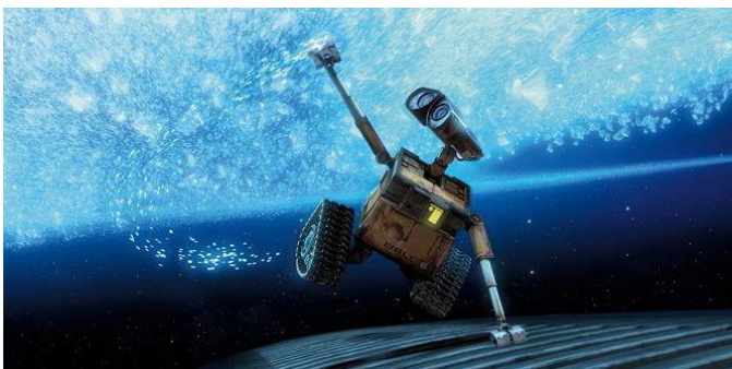
Robotul omonim al lui WALL-E

Reciclarea este un imperativ pentru sănătatea planetei. Schimbarea începe cu noi : o mică sămânță de investiție în viitorul speciei noastre este deprinderea unor bune obiceiuri de gospodărire.