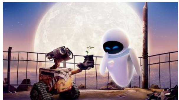
WALL-E și EVE